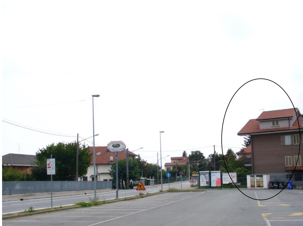
Foto 04 – parcheggio edificio commerciale – sullo sfondo edificio tre piani fuori terra