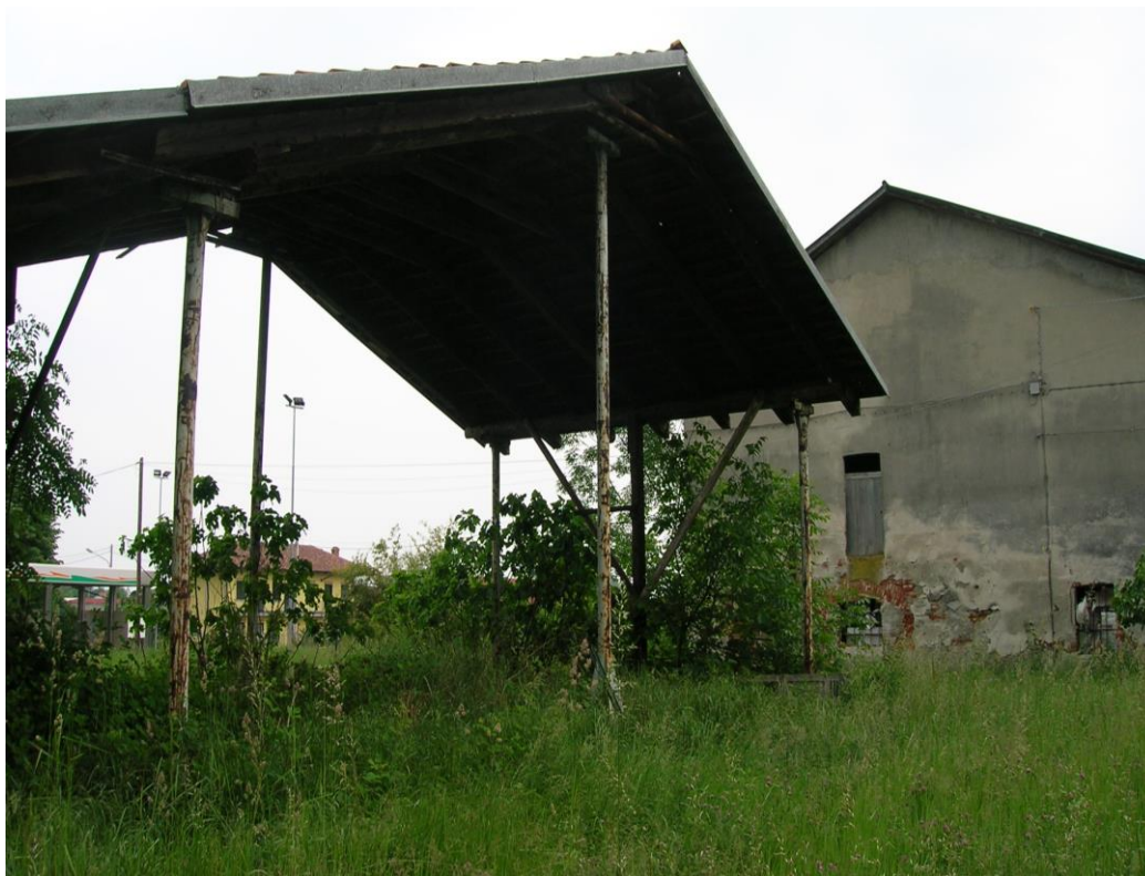
Foto 09 – tettoia in ferro esterna alla corte del fabbricato principale