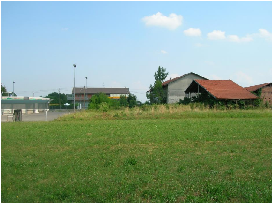
Foto 08-09 – vista autolavaggio confinante a nord – sullo sfondo edificio a due piani fuori terra su via Torino con distributore di benzina – a lato gli edifici oggetto di intervento