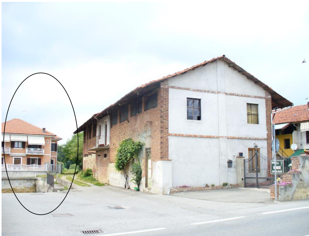
Foto 05 – prospetto da via Torino- sullo sfondo edificio confinante - due piani fuori terra