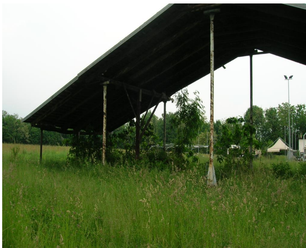
Foto 10 – tettoia in ferro esterna alla corte del fabbricato principale