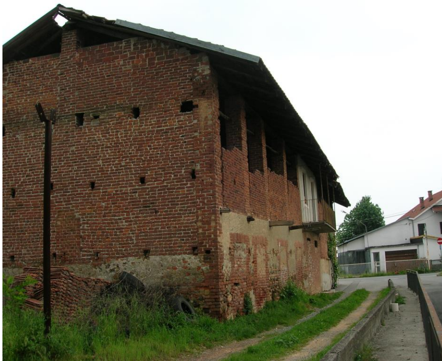
Foto 03 – edifici vista sud e strada privata di accesso esistente